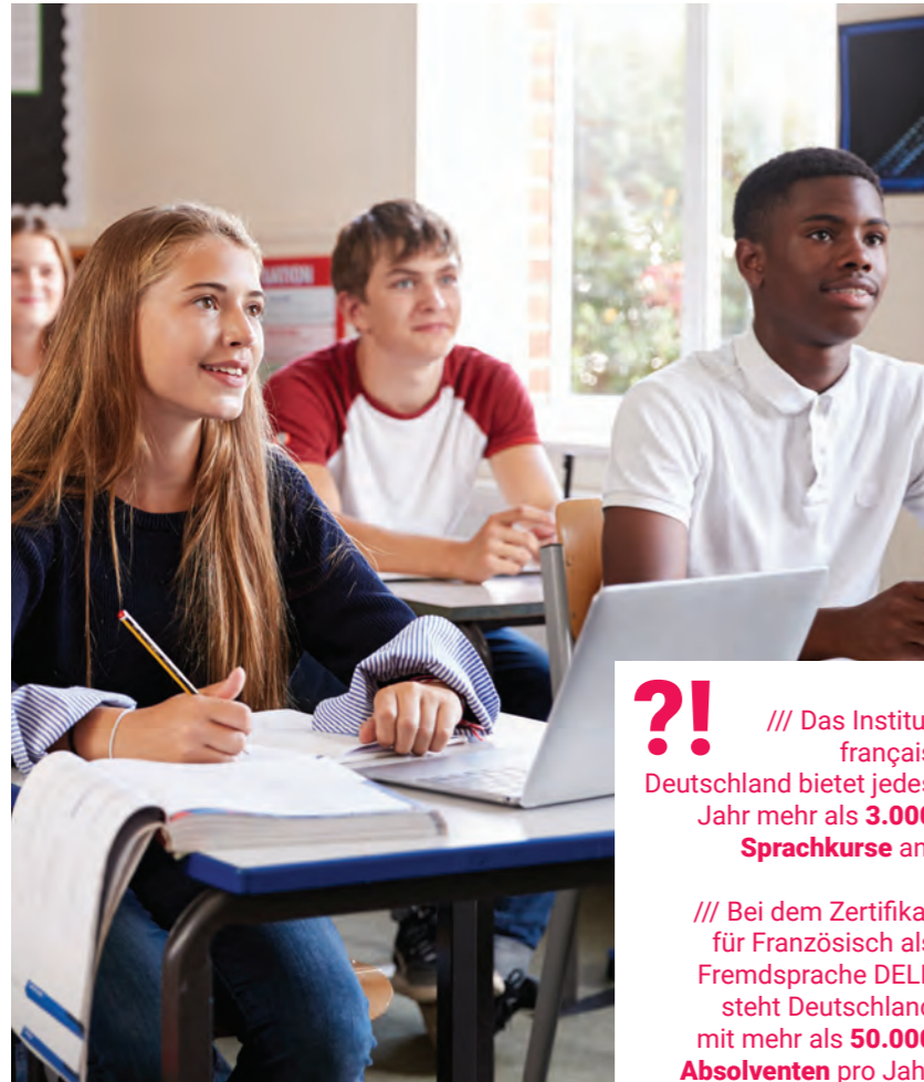
Sprachkurse für alle Altersgruppen beim Institut français Deutschland.

?! /// Das Institut français Deutschland bietet jedes Jahr mehr als 3.000 Sprachkurse an.