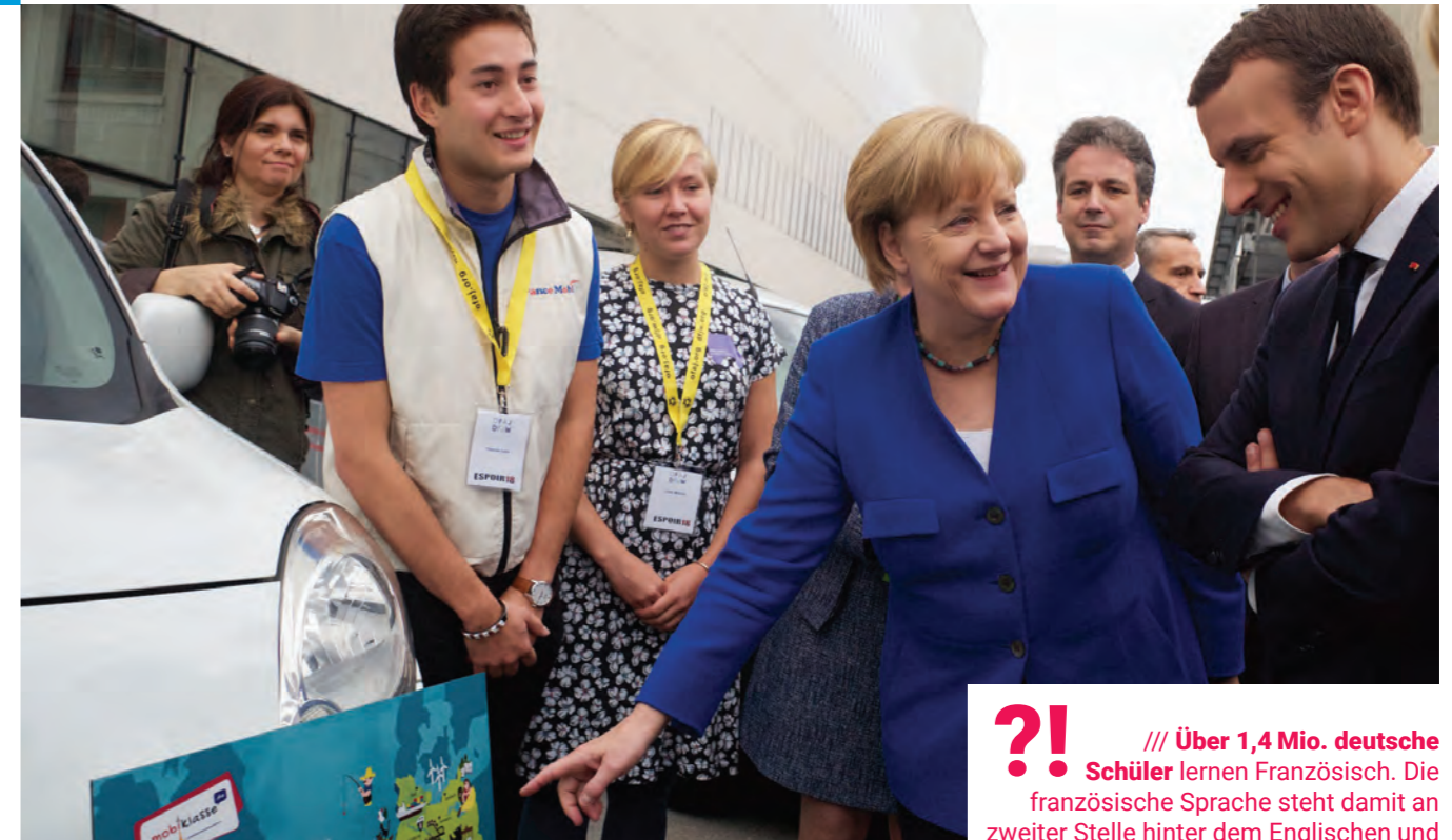
Bundeskanzlerin Angela Merkel und Staatspräsident Emmanuel Macron informieren sich über FranceMobil.

?! /// Über 1,4 Mio. deutsche Schüler lernen Französisch. Die französische Sprache steht damit an zweiter Stelle hinter dem Englischen und vor dem Spanischen.