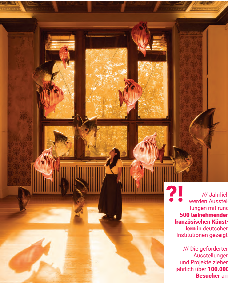
Ausstellung des französischen Künstlers Philippe Parreno im Berliner Gropius Bau 2018.