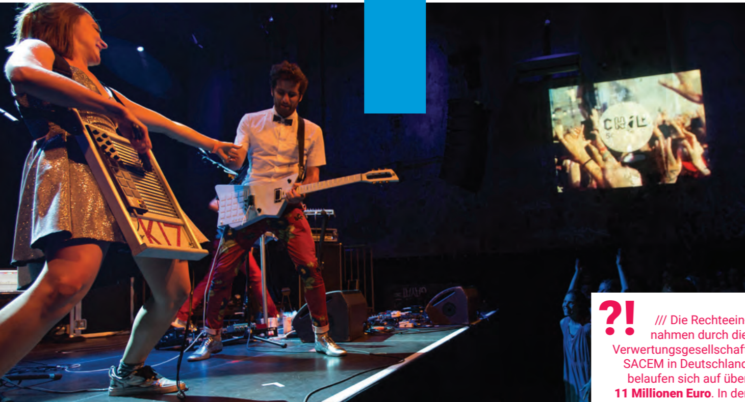
Konzert des französischen Elektropop-Duos KIZ im Rahmen der Fête de la Musique in Berlin.

Französische Künstler aus dem Bereich Pop / U-Musik sind in Deutschland besonders erfolgreich. Das BUREAU EXPORT fungiert in Kooperation mit dem Institut français als Mittler und Berater zwischen den Märkten im Bereich der U- und E-Musik (Plattenfirmen, Konzertagenturen, Festivals, PR-Agenturen, Künstler, Musikverleger, Ensembles usw.) und unterstützt die französische Musikbranche auf vielfältige Weise bei ihren Export-Aktivitäten auf dem deutschsprachigen Markt. In der zeitgenössischen Musik fördert der deutsch-französisch-schweizerische Fonds für zeitgenössische Musik Impuls Neue Musik Austauschprojekte in den drei Ländern.