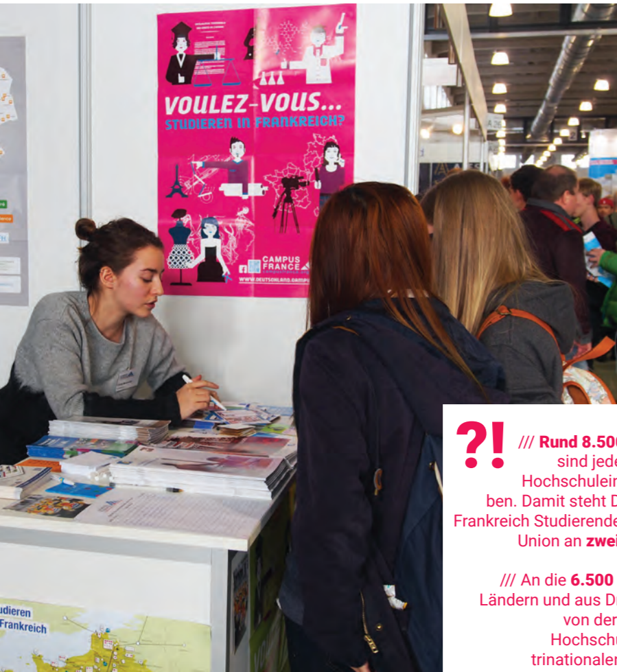
Campus France informiert deutsche Interessierte über die Studienangebote in Frankreich.

Im Hochschulbereich fördert das Institut français Deutschland den Ausbau von Partnerschaften zwischen Hochschuleinrichtungen , hilft bei der gegenseitigen Anerkennung universitärer und beruflicher Abschlüsse, berät gezielt über Studienmöglichkeiten in Frankreich und organisiert Diskussions- und Vortragsveranstaltungen zu aktuellen Fragestellungen. Das Büro für Zusammenarbeit im Hochschulwesen und sein Informationsbüro Campus France arbeiten dabei eng mit der Deutsch-Französischen Hochschule (DFH), dem Deutschen Akademischen Austauschdienst (DAAD) und dem Centre Marc Bloch zusammen. Des Weiteren kooperiert das Hochschulbüro mit der französischen Elitehochschule Ecole nationale d'administration (ENA) und mit der Gesellschaft der deutschen ehemaligen ENA-Schüler e.V..