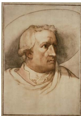
Johann Heinrich Wilhelm Tischbein (1751–1829) Etude de tête -Goethe dans la campagne romaine, vers 1786-1787 ou 1793 Plume, encre brune et aquarelle 572 x 453 mm