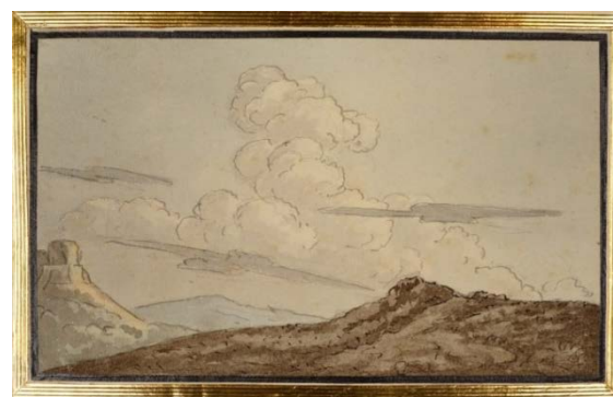
Johann Wolfgang von Goethe (1749–1832) Masse de nuages en forme de tour, vers 1810 Plume et pinceau, encres grise et brune, aquarelle 148 x 223 mm