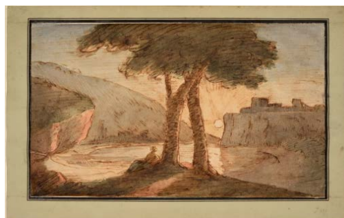
Johann Wolfgang von Goethe (1749–1832) La côte napolitaine à Posillipo, 1808 Plume, encre brune et aquarelle 185 x 311 mm