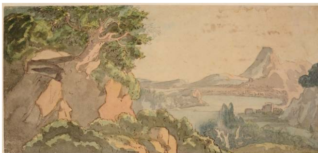
Johann Wolfgang von Goethe (1749–1832) Paysage sicilien, 1808 Mine de plomb, plume, encre brune et aquarelle 160 x 345 mm