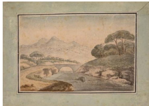
Johann Wolfgang von Goethe (1749–1832) Pont sur l'Anio, 1786/1787 Plume, encre grise et aquarelle 138 x 205 mm