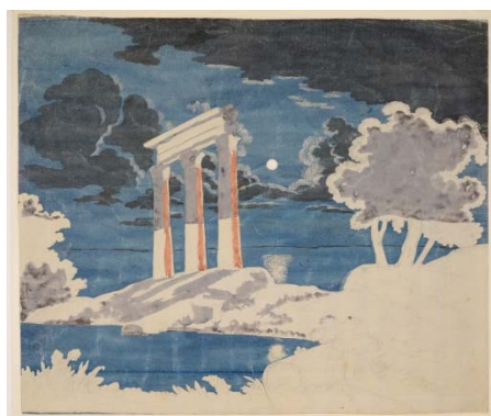
Johann Wolfgang von Goethe (1749–1832) Ruine de temple, vers 1820 Mine de plomb et aquarelle, rehaussée de blanc 388 x 455 mm